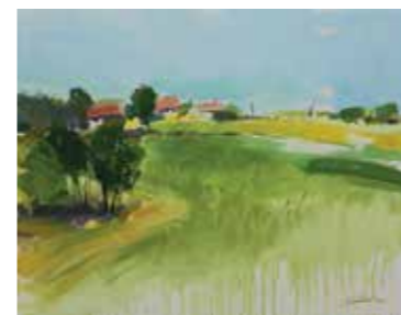
ЉИЉАНА ЂУРЂЕВИЋ ▶