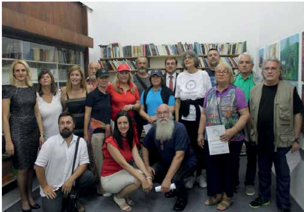
ГРУЖАНСКА ЈЕСЕН 2016.