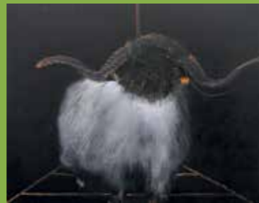
ОБРАД ЈОВАНОВИЋ ▶