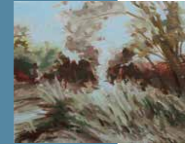
ГОРДАНА ЖИВАНОВИЋ ▶