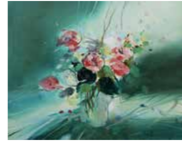
МИЛОШ САРИЋ ▶