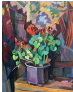
МАЈА ЂОКИЋ ▶