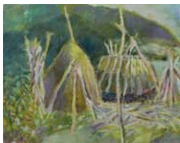
МИЛИЈАНА ЈОВАНОВИЋ ▶