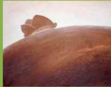
СТАНКА ТОДОРОВИЋ ▶