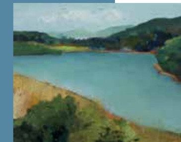
ЈОВАНА ДАМЉАНОВИЋ ▶