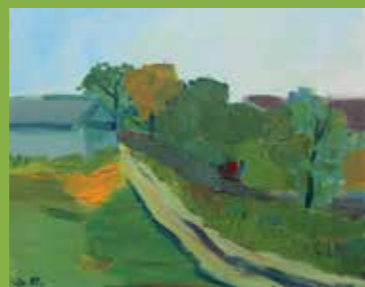
ГОРАН РАКИЋ ▶